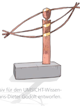
Skulptur exklusiv für den UMSICHT-Wissenschaftspreis von Hans-Dieter Godölt entworfen.