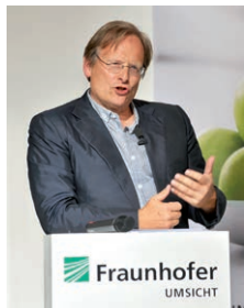
Prof. Dr. med. Dietrich Grönemeyer

»Genauso wie in der Medizin geht es mir darum, dabei zu helfen, dass auch komplexe Themen aus Wissenschaft und Technik für die Bevölkerung gut verständlich dargestellt werden. Dies ist ein wesentlicher Baustein auf dem Weg, den Nachwuchs für die Wissenschaft zu begeistern. Vor diesem Hintergrund begrüße ich es sehr, dass auch die publizistische Qualität und die damit verbundene Allgemeinverständlichkeit bei der Präsentation der Forschungsarbeiten maßgeblich in die Bewertungskriterien mit einfließt.«