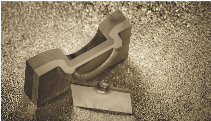
Bild: Gesamtblechdicken von bis zu 18 mm form- und kraftschlüssig fügen: konventionelles Verfahren im Feinblechbereich (unten) vs. Dickblechclinchen (oben).

Fraunhofer-Gemeinschaftsstand HALLE 3/STAND 3413 -----