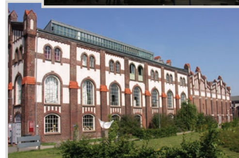
Im Rahmenprogramm: Zeche Zollverein, Museum Folkwang, Rewirpower-Stadion, Zechengelände Waltrop (von oben).